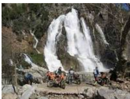
4 - Taşkent - Karapınar -