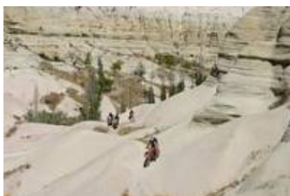
6 - Güzelyurt - Göreme -