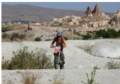
2 - Antalya - Akseki -