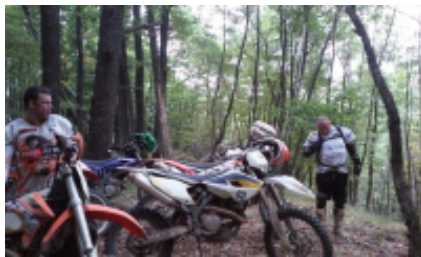
1 - - Sibiu -