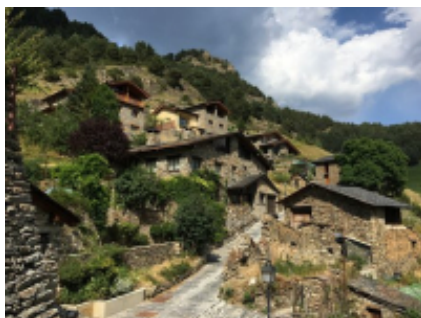
2 - Montpellier - Andorra la Vella -