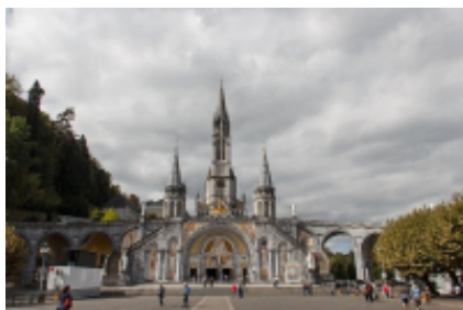
3 - Andorra la Vella - Tarbes -