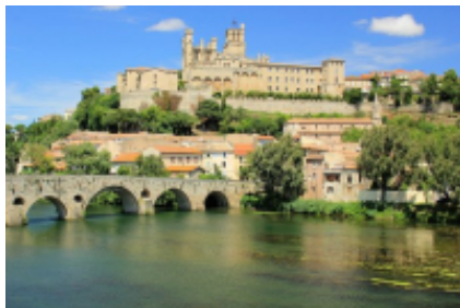
1 - Marseille - Montpellier -