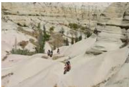
6 - Güzelyurt - Göreme -