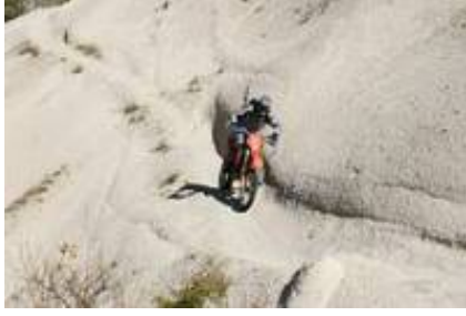
1 - - Antalya -