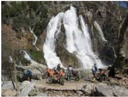
4 - Taşkent - Karapınar -