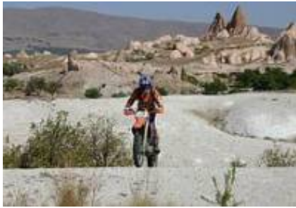
2 - Antalya - Akseki -