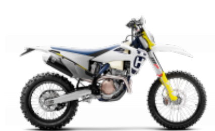
FE 350 + $0.00