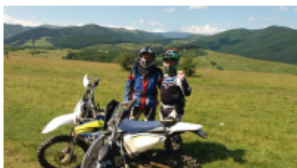
2 - Sibiu - Măgura - 6h