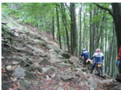
6 - Sibiu - Măgura - 8h