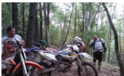
1 - - Sibiu -