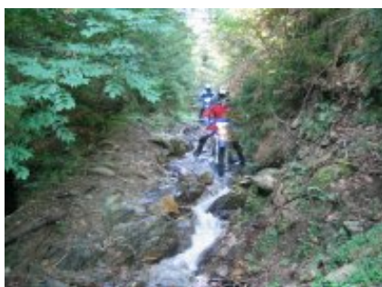
5 - Sibiu - Lacul Negovanu -