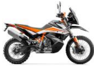
790 Adventure + $260.46