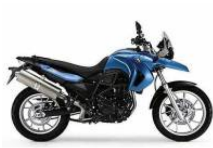
G 650 GS Twin + $0.00