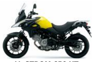
V- STROM 650 XT + $0.00