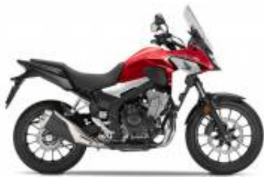
CB 500 X + $0.00