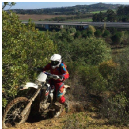
5 - Santarem - Santarem - 140 km