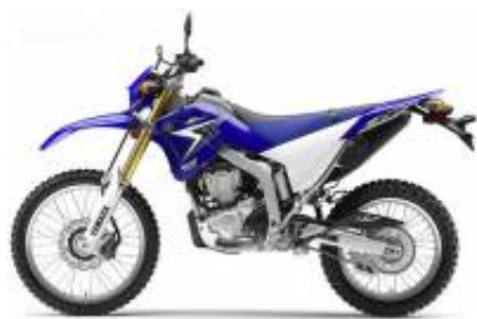
WR 250 + $0.00