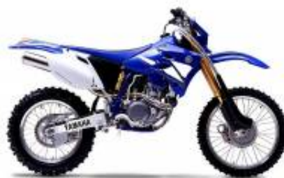
WR 450 + $0.00