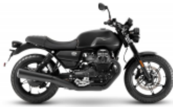
V7 Stone 800 + $0.00