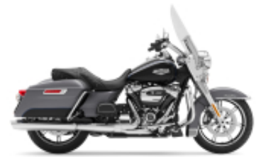
Road King Street Classic Class + $682.68