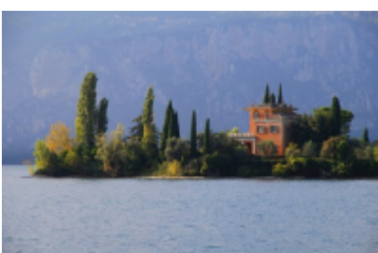
6 - Innsbruck - Gardasee -