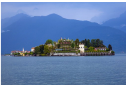
3 - Turin - Chur -