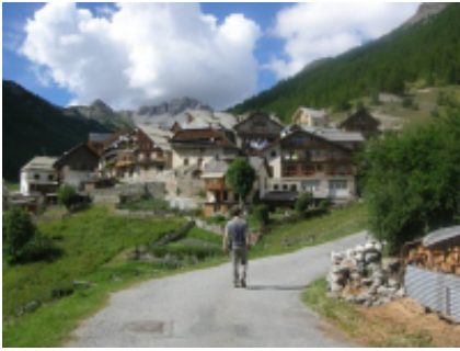
2 - Marseille - Turin -