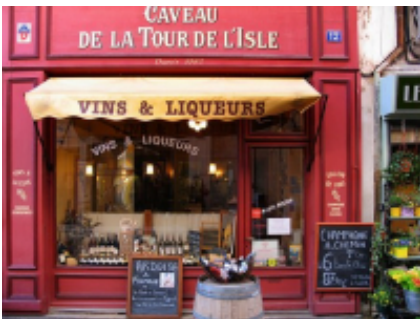
4 - Mouriès - Mouriès -