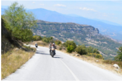
1 - Flughafen Thessaloniki - Thessaloniki - 30