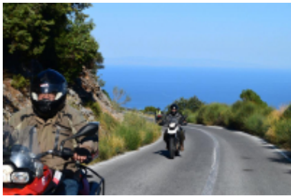
2 - Thessaloniki - Platamonas - 184