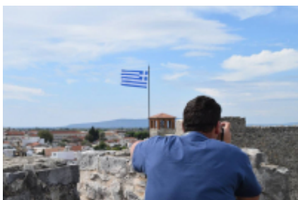
5 - Athen - Athen - 0