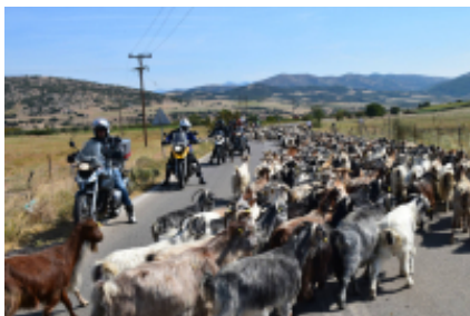
4 - Lamia - Athen - 275