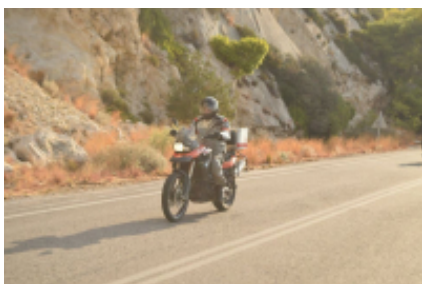
6 - Athen - Patras - 226