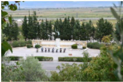
3 - Platamonas - Lamia - 310