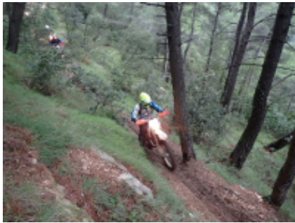
2 - Athen - Athen - 140