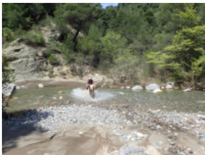
4 - Athen - Athen - 0