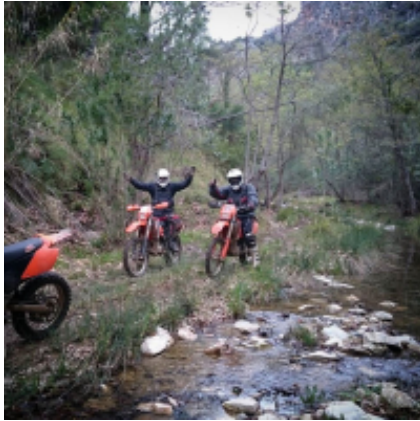
1 - Athen - Athen - 0