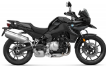
F 750 GS + $0.00