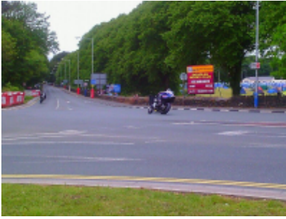
2 - Douglas - Douglas -