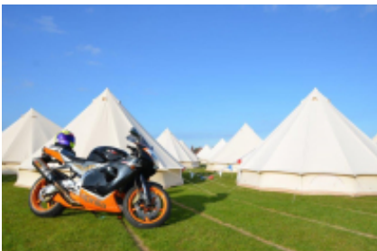
4 - Douglas - Douglas -