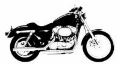
6 - Douglas - Douglas - 0