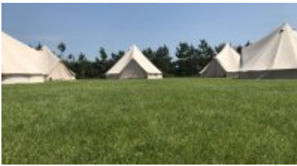
3 - Douglas - Douglas -