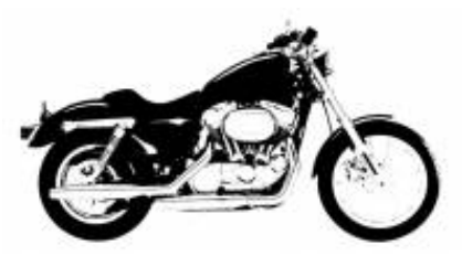
5 - Douglas - Douglas - 0