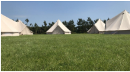
3 - Douglas - Douglas -