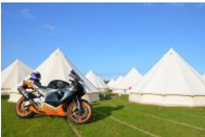
4 - Douglas - Douglas -