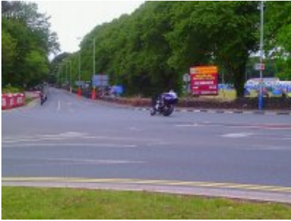
2 - Douglas - Douglas -