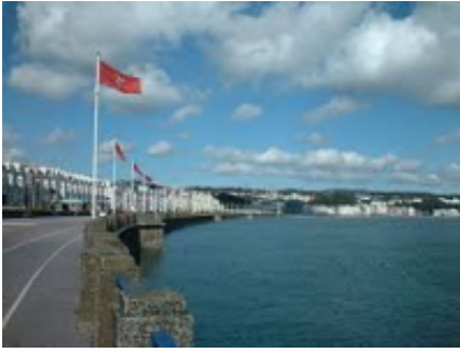
1 - Liverpool - Douglas -