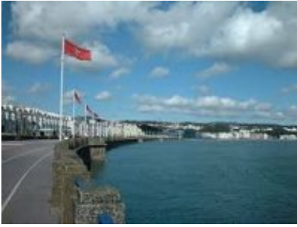
1 - Liverpool - Douglas -