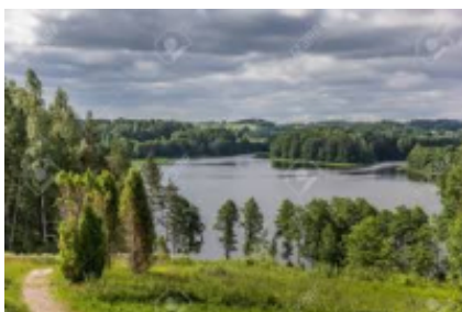
6 - Nationalpark Aukštaitija - Nationalpark Aukštaitija -