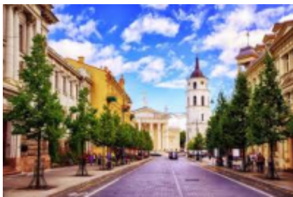
5 - Nidden - Vilnius - 400 km