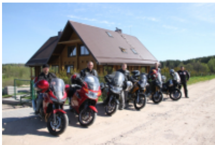
4 - Kaunas - Nidden - 320 km