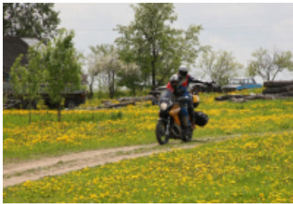
3 - Kaunas - Kaunas - 320 km