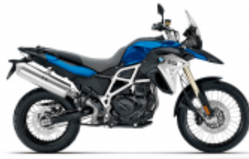
F 800 GS + $76.20