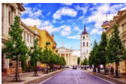
5 - Nida - Vilnius - 400 km