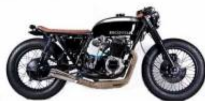
CB 500 Cafe Racer + $0.00