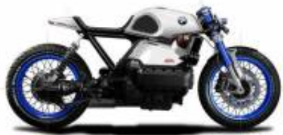
K75 Cafe Racer + $0.00