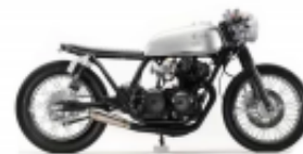
CB 250 Cafe Racer + $0.00