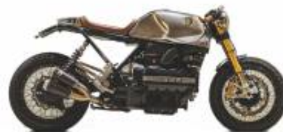
K 100 RS Caferacer + $0.00