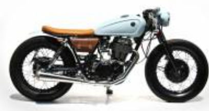
SR 250 Caferacer + $0.00