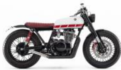
XS 400 + $0.00