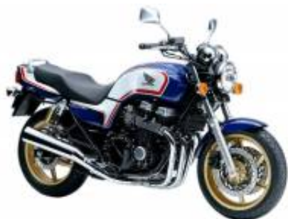
CB 750 + $0.00