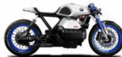
K75 Cafe Racer + $0.00