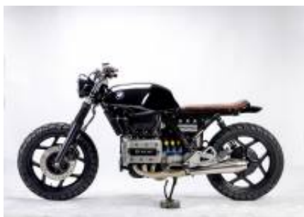
K75 Scrambler + $0.00