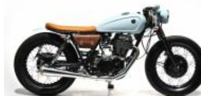
SR 250 Caferacer + $0.00