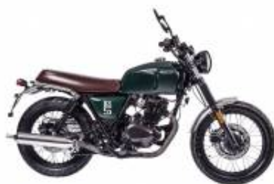
BX 125 + $0.00