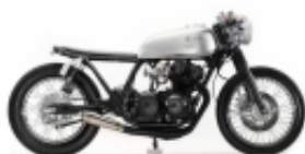
CB 250 Cafe Racer + $0.00