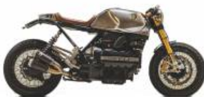
K 100 RS Caferacer + $0.00