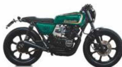
KZ550 Caferacer + $75.70