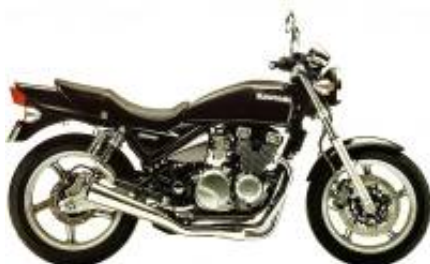
Zephyr 550 + $0.00