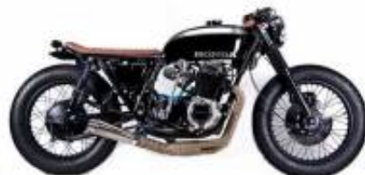
CB 500 Cafe Racer + $0.00