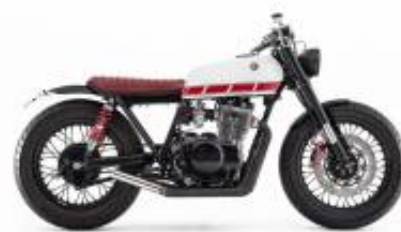
XS 400 + $0.00