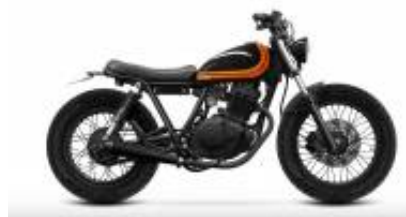
SR125 Caferacer + $0.00