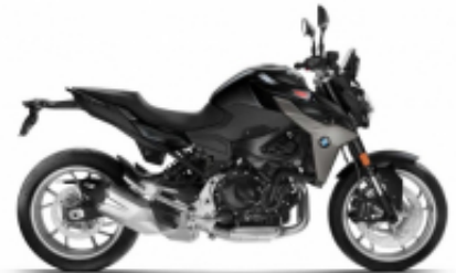
F 900 R + $0.00