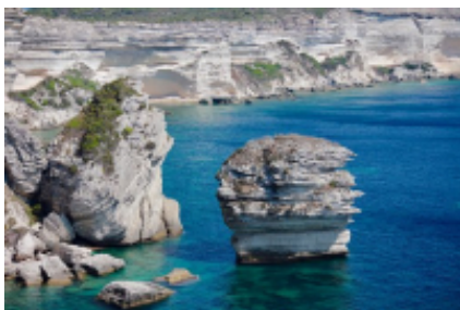
5 - Bonifacio - Marsella -