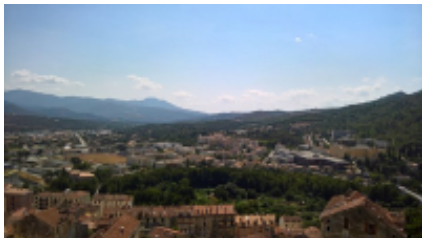
3 - Corte - Corte -