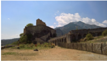
2 - Corte - Corte -