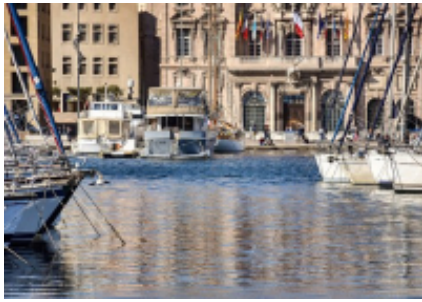
1 - Aeropuerto de Marsella-Provenza - Marsella -