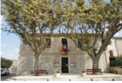
1 - Marsella - Mouriès -