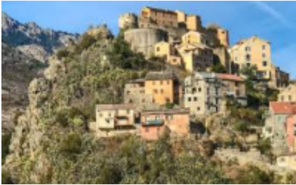
9 - Bastia - Corte -