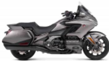
Goldwing DCT 2018 + $575.37