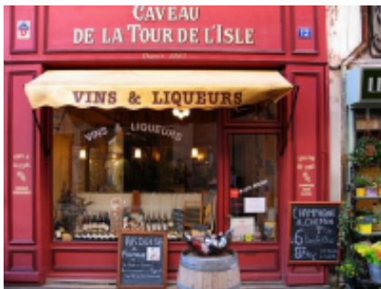
4 - Mouriès - Mouriès -