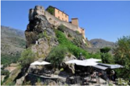
10 - Corte - Corte -