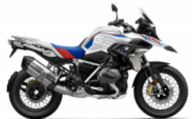
R 1250 GS + $522.37