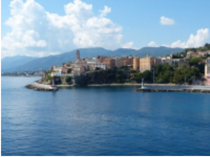
8 - Marsella - Bastia -