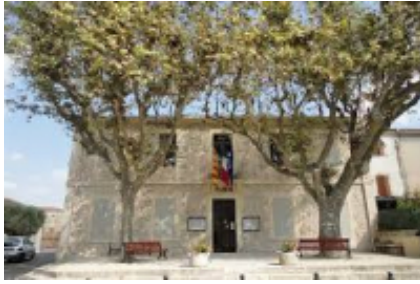
1 - Marsella - Mouriès -