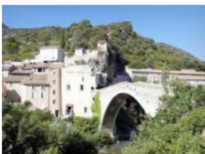
6 - Manosque - Draguignan -