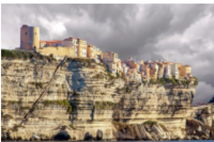
12 - Corte - Bonifacio -