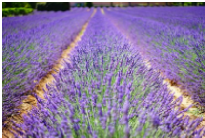
3 - Mouriès - Mouriès -