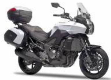
Versys 1000 Grand Tourer + $522.37