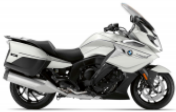
K 1600 GTL + $575.37