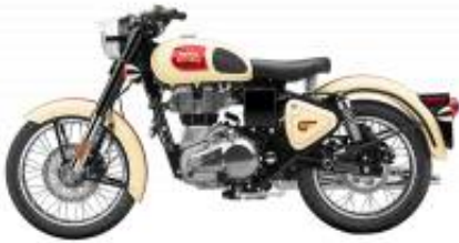
Tan 350 + $0.00