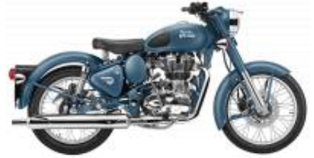
Squadron Blue 500 + $0.00