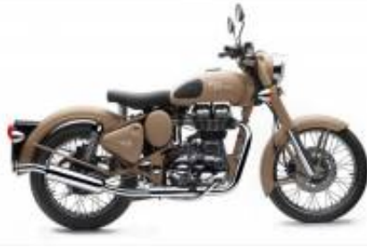
Classic Desert Storm 500 + $0.00