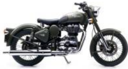
Military 500 + $0.00