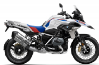
R 1250 GS + $910.56