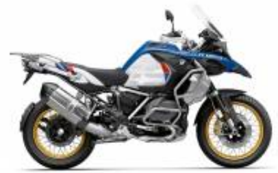
R 1250 GS Adv LC + $396.77