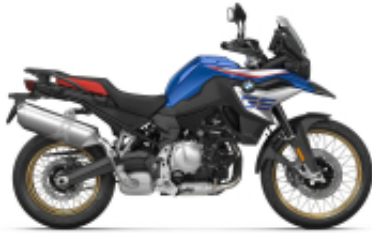
F 850 GS + $198.39