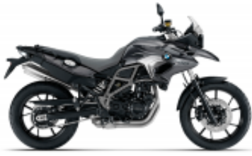
F 700 GS + $0.00