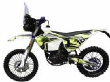
Rally 450 + $0.00