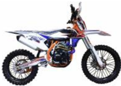
Sixdays 450 + $0.00