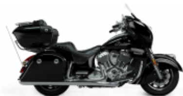
Roadmaster 1890 Grand Touring Class + R$ 1.704,33