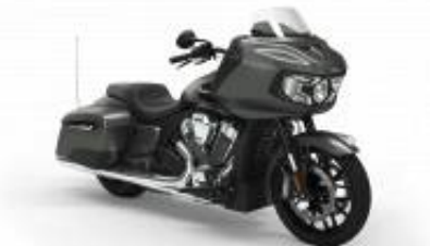
Challenger Street Touring Class + R$ 2.215,63