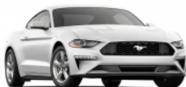
Mustang + R$ 5.652,69