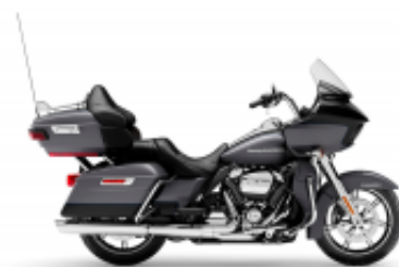
Road Glide Grand Touring Class + R$ 1.704,33