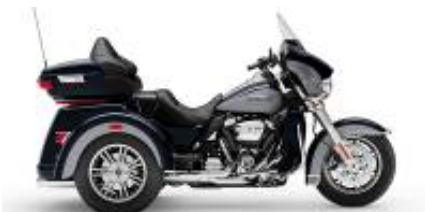
Trike Tri Glide (Gen) + R$ 9.601,06