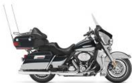
Road Glide Ultra Grand Touring Class + R$ 1.704,33