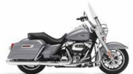
Road King (Gen) Cruiser Touring Class + R$ 0,00