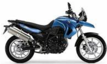
G 650 GS Twin + $700.00