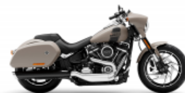
Sport Glide + $700.00