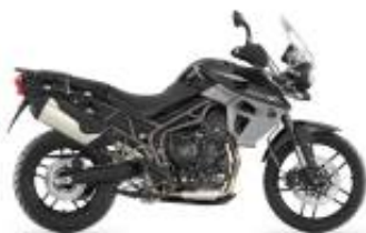
Tiger 800 XRX + $700.00