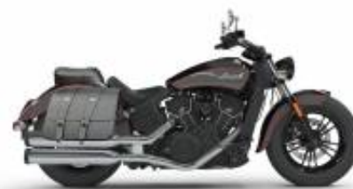
Scout Sixty + $700.00