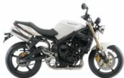
Street Triple 675 + $700.00