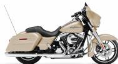
Street Glide Special + $700.00