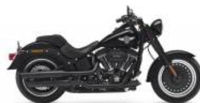
Fat Boy + $700.00