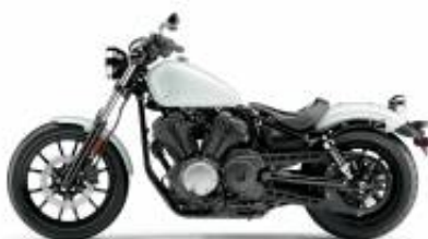
XV 950 Bolt + $700.00