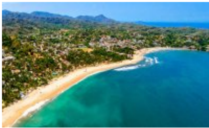
5 - Sayulita - Circuito Sayulita - Sayulita