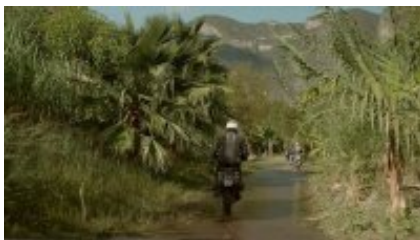
6 - Sayulita - San Pedro Tlaquepaque - Sayulita - Tlaquepaque