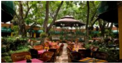
4 - Tequila - Sayulita - Tequila - Sayulita