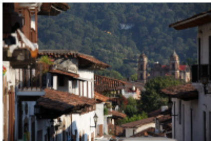
2 - Valle de Bravo - Morelia - Valle de Bravo - Morelia