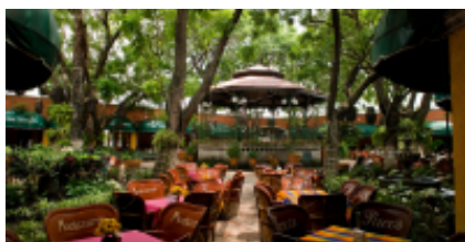
4 - Tequila - Sayulita - Tequila - Sayulita