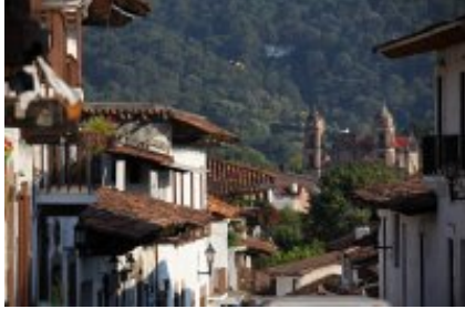
2 - Valle de Bravo - Morelia - Valle de Bravo - Morelia