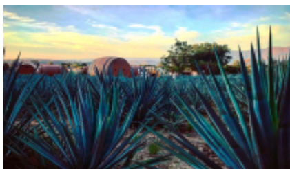
3 - Morelia - Tequila - Morelia - Tequila