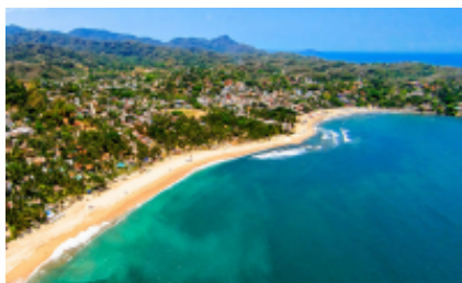
5 - Sayulita - Circuito Sayulita - Sayulita