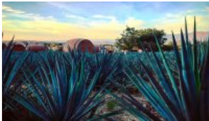
3 - Morelia - Tequila - Morelia - Tequila