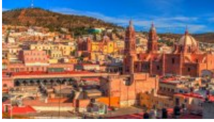
1 - Ciudad de México - Valle de Bravo - CDMX - Valle de Bravo (van)