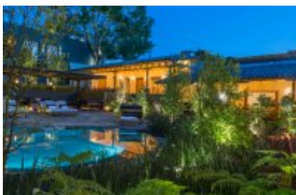
7 - San Pedro Tlaquepaque - Zacatecas - Tlaquepaque - Zacatecas