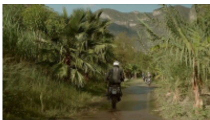
6 - Sayulita - San Pedro Tlaquepaque - Sayulita - Tlaquepaque