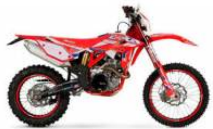
RR 430 4T + $0.00