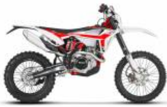
4t. 350 + $0.00