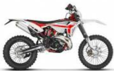
RR 300 2T + $0.00