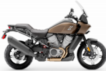
Pan America 1250 + $0.00