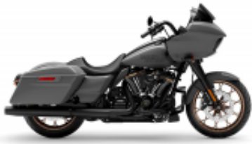
Street Touring Road Glide + $0.00