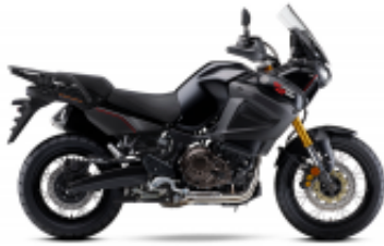
Super Tenere 1200 + $0.00