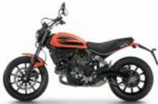
Scrambler Sixty2 400 + $323.75