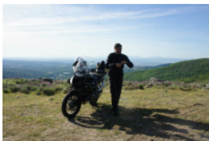
1 - Oporto - Viseu - 270