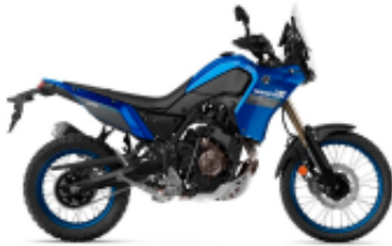
Tenere 700 + $386.23