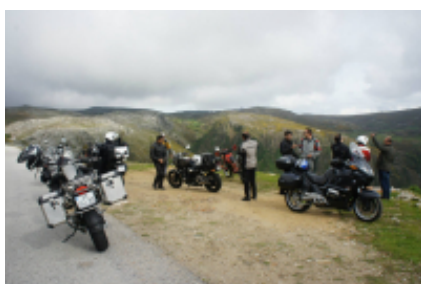
5 - Salamanca - Oporto - 373