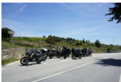
2 - Viseu - Plasencia - 310