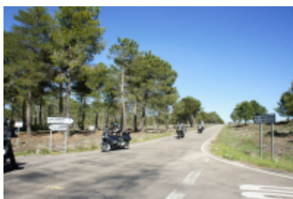
3 - Plasencia - Ávila - 240