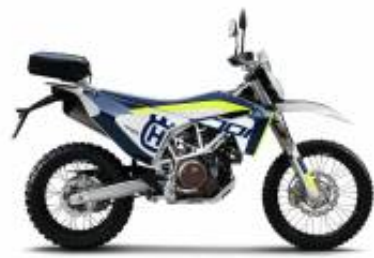
701 Enduro + $0.00