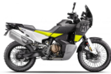
Norden 901 + $0.00