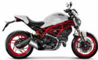
Monster 797 + $364.64