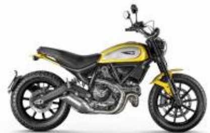
Scrambler Icon 800 + $208.37