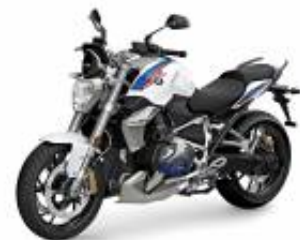
R 1250 R + $416.73