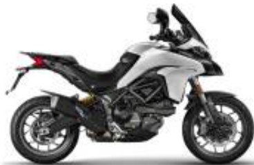
Multistrada 950 V2 + $364.64