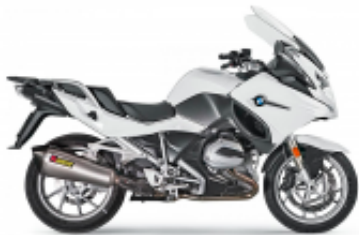
R 1200 RT + $416.73