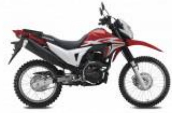
XR 190 + $0.00