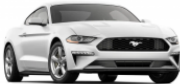
Mustang + $780.00