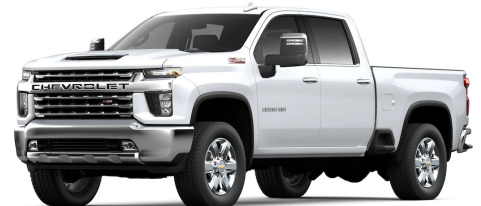
Chevy Silverado 2500 HD Truck + $2,275.00