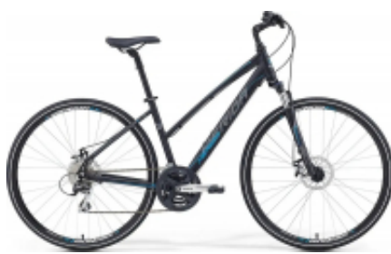
Crossway 20 Lady