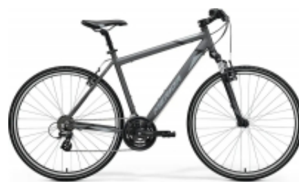
Crossway 20 Man