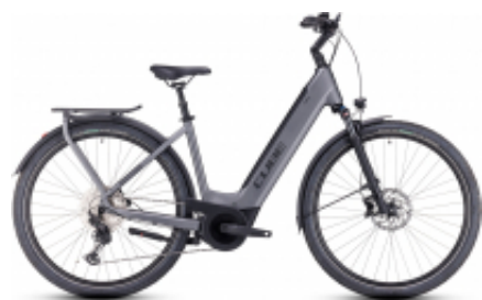
Touring Hybrid 500 Easy Entry