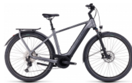
Touring Hybrid 500 One