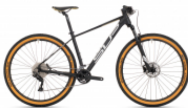
XC 879 + $14.04