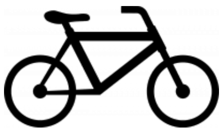
Mi bicicleta + $0.00