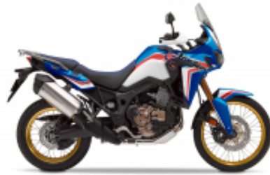
Africa Twin CRF 1000 L + $442.37