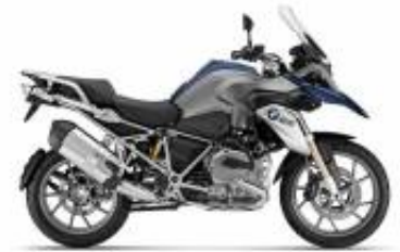
R 1200 GS + $442.37