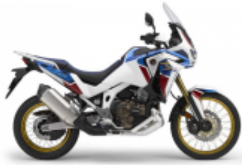
CRF1000L Africa Twin Adventure Sports + $453.98