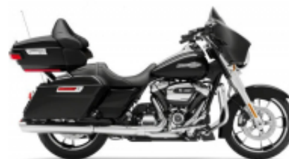
Street Glide Street Touring Class + $280.00