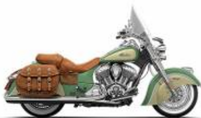
Chief Vintage + $420.00