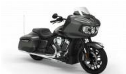
Challenger Street Touring Class + $420.00