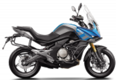
650MT 2022 + $1,124.25