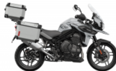
Tiger 1200 Alpine Edition + $2,147.44