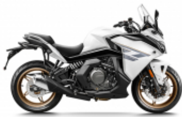
650GT + $1,124.25