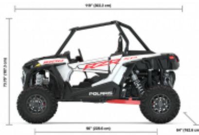
RZR 1000 XP + $0.00