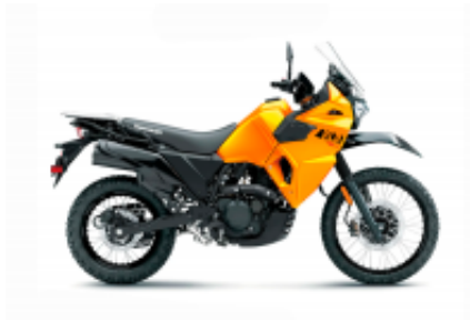
KLR 650 + $0.00