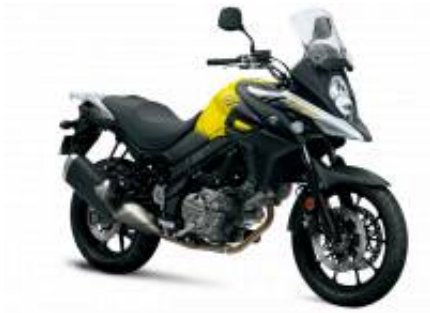
DL 650 V Strom + $200.00