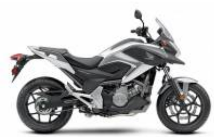
NC 750 X + $0.00