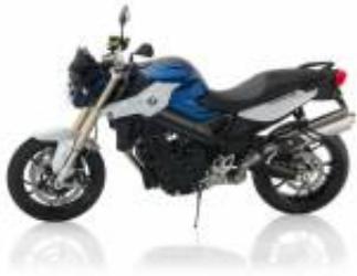
F 800 R + $99.19