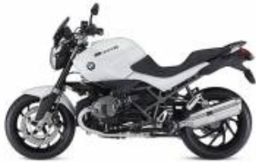
R 1200 R + $99.19