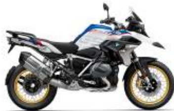
R 1250 GS HP Edition + $0.00