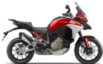
Multistrada V4 + $0.00