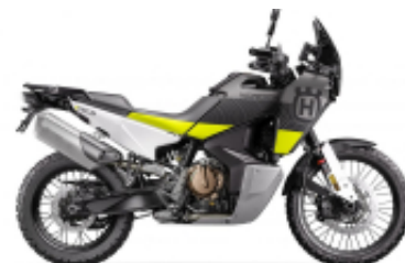
Norden 901 + $0.00