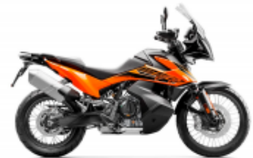
890 Adventure + $0.00