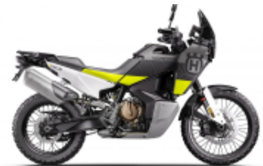
Norden 901 + $0.00