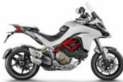
Multistrada 1260 V4 + $0.00