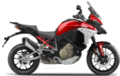
Multistrada V4 + $0.00