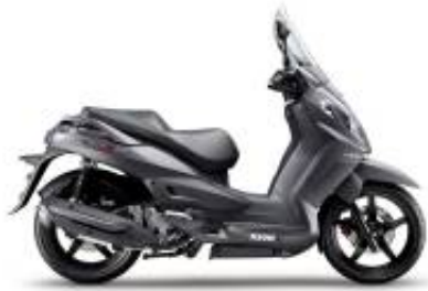
Citycom 300 + $0.00