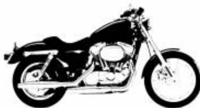
Road Glide GPS incl. Touring Class + £0.00