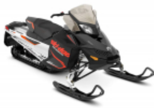
Bombardier 600 + $0.00